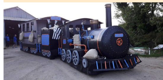
Le char du carnaval 2016

Vous pouvez retrouver le formulaire sur le site internet www.saint-urbain.com rubrique services/tarifs communaux.