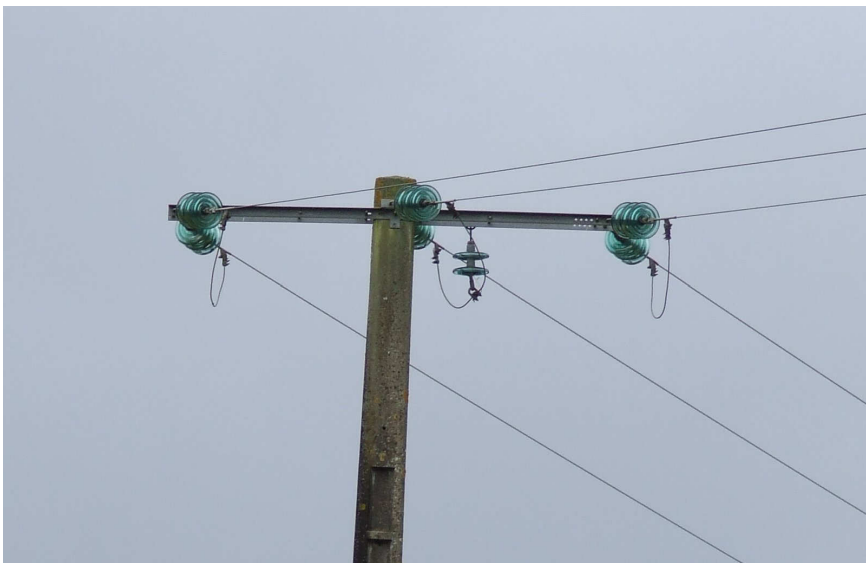
Exemple d'une ligne 20 000 volts que l'on trouve fréquemment dans nos campagnes : ligne à trois fils nus et isolateurs suspendus.

* : Service DR-DICT : 64 boulevard Voltaire – BP 90937 – 35000 Rennes Cedex Tél : 02 99 03 55 87