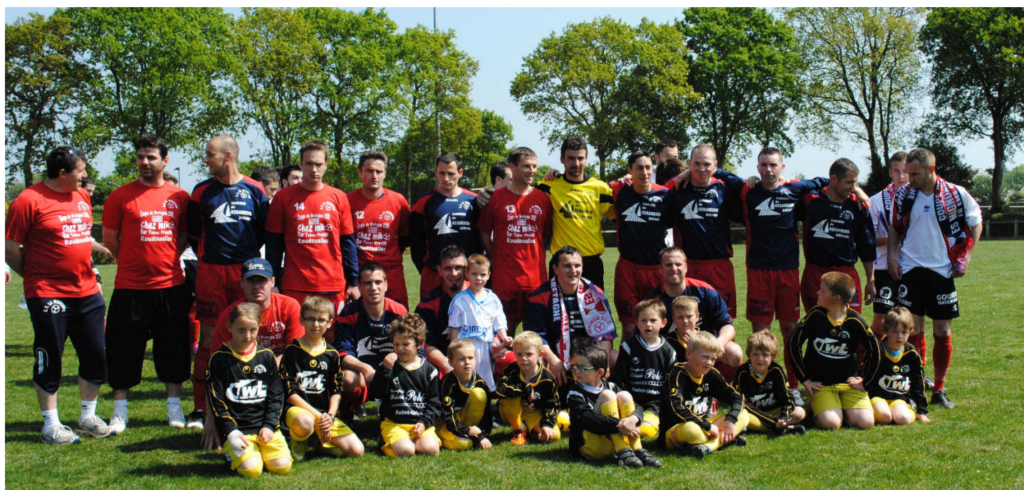
Ci-dessus : l'équipe lors du coup d'envoi, avec les jeunes joueurs de l'école de foot de l'ES Mignonne.

Match du 29 mai quart de finale de la coupe de district Finistère Nord contre Gouesnou. L'équipe A de l'ES Mignonne s'est bien défendue. Menée 2 à 1, elle a égalisé à la dernière minute du temps réglementaire et malgré leur belle performance, l'ES Mignonne s'incline finalement 3-2 au cours des prolongations.