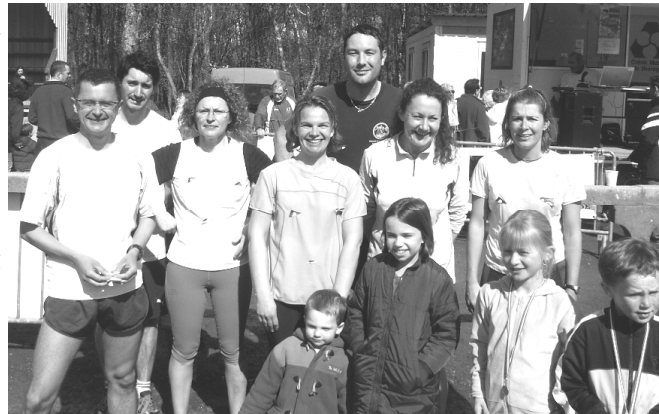
Les participants aux 15 km à l'arrivée de la course

Prochain rendez-vous des coureurs de l'association : le trail de Saint-Urbain le dimanche 15 juin.